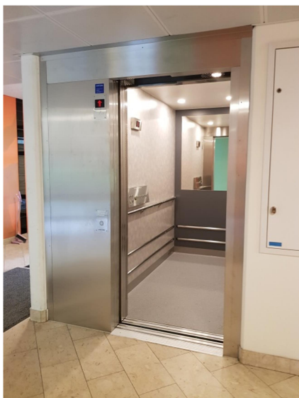
Smedjevägen 1 och 23 samt Häggviksvägen 19 har nyrenoverade hissar.