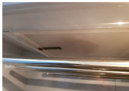
Ta loss filtret med hjälp av den svarta tygremsan.

För allas trevnad måste man städa efter sig. Ingen ska behöva börja sin tvättid med att rengöra efter andra. Läs även instruktionerna som finns uppsatta i förrummet.