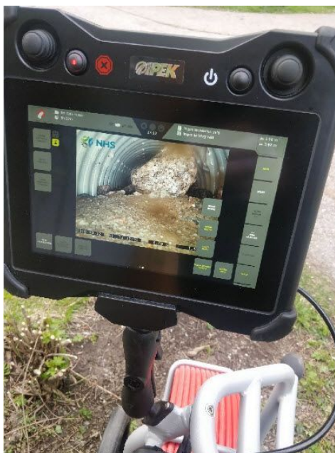
I ett av dräneringsrören påträffades en stor sten.

Slamsugning av dagvattenbrunnar har inte gjorts på många år. Under senvåren har NHS (Nordisk högtrycksspolning) varit verksamma med att filma och spola igenom dräneringsrören i hela området. Under spolningen påträffades ett stopp i hörnet av H 21. Rören behöver lagas på några ställen. Två brott på rörledningen längs H15 mot gångvägen upptäcktes. Det går dock lätt att åtgärda eftersom de rören inte ligger så djupt. Dräneringsrören i området är av plast, vilket är bra eftersom det hindrar inväxning av rötter i systemet. Vissa brunnar, som doldes under uteplatser, orsakade en del merarbete.