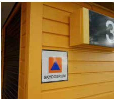
Ingångarna till våra skyddsrum är tydligt skyltade som här vid Smedjevägen 3.