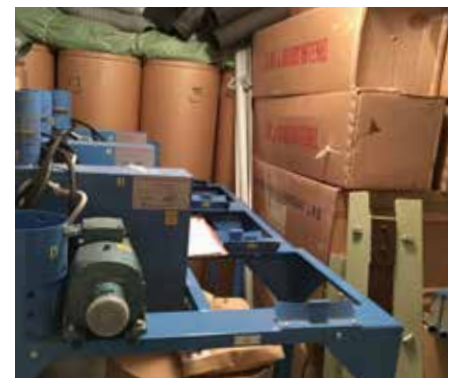
Vi har förråd med material som ska placeras ut inom 48 timmar i händelse av krig.