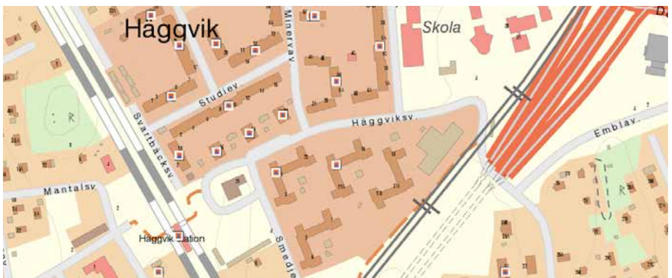
På Myndigheten för samhällsskydd och beredskaps webbplats kan man se att våra skyddsrum är inprickade.