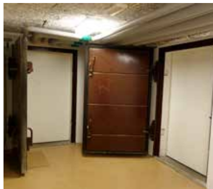
Väggar och dörrar är konstruerade för att klara både bomber, brand och bråte från rasande hus.