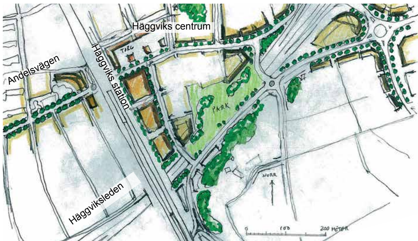
Framtidsbild ur kommunens översiktsplan "möjlig utveckling mot 2030".

Faksimil ur kommunens översiktsplan om Häggvik.