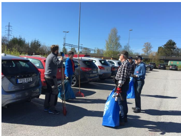
Även P-platsen vid stationen städades.