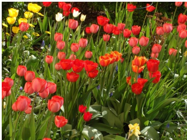
Tulpanerna hade redan hunnit slå ut.

Två hela bildsidor får skildra den trevliga dagen.