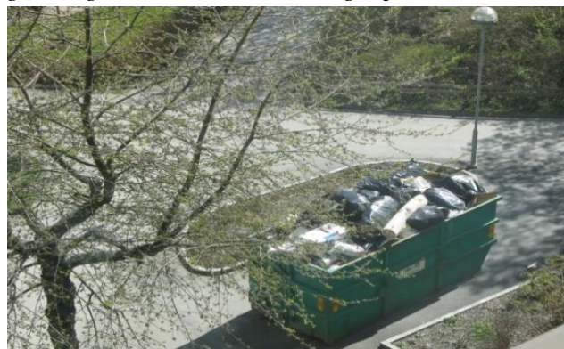
Den tillfälliga containern blev fylld till brädden.