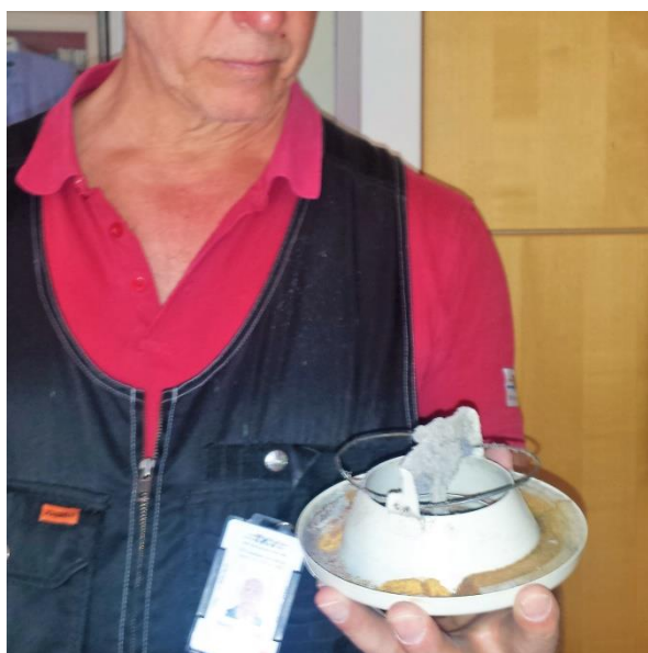
Damm och smuts samlas på insidan av ventilen.