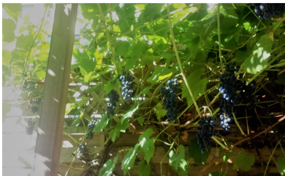
Men fruktskörden blir desto rikligare. Druvor behöver inte så mycket vatten...