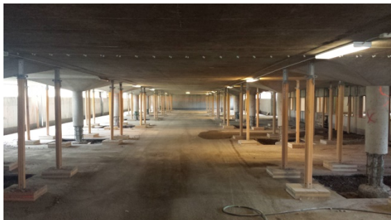
Bild från garaget vid det öppna huset som anordnades den 8 juni. Här ser man att betongpelarna frilagts så att fundamentet under det befintliga golvet blir synligt för inspektion och åtgärd.

Detta sagt med tanke på det sabotage som skedde tidigare i våras. Som tur är har vi inte haft flera sådana försök.