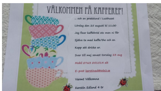
Kerstins inbjudan till trapphusmöte.