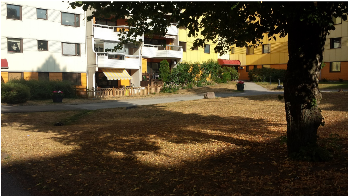
Bruna gräsmattor överallt på gårdarna i Gula Husen.