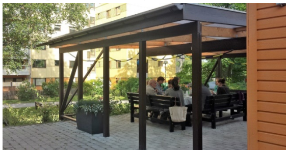
Familjefest i Smedjan.