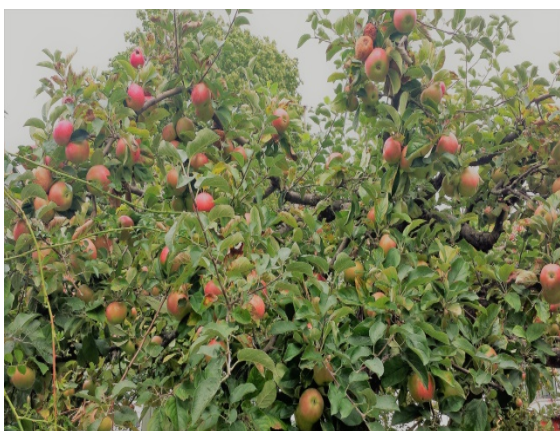
...och äpplena trängs på trädens grenar.

Minns ni vintern? När den väl kom i januari följde låga temperaturer och snö i massor. Inte förrän i slutet av mars ville den släppa taget.