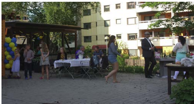
Familjen firar nybakad student vid Smedjan.

Uteplatserna Smedjan, Oasen och Lustgården står inbjudande och väntar på ditt besök i sommar! Invitera dina vänner på kaffe, grillning eller bara en pratstund i solen på våra nyrenoverade uteplatser.